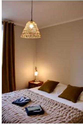
Georgette de Soie