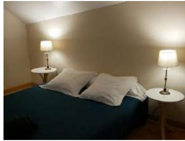
Moulin à Vent