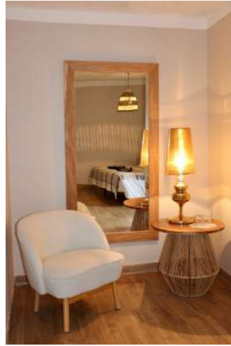
Jacquard de Soie